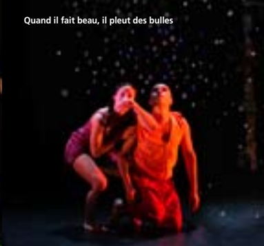
Quand il fait beau, il pleut des bulles