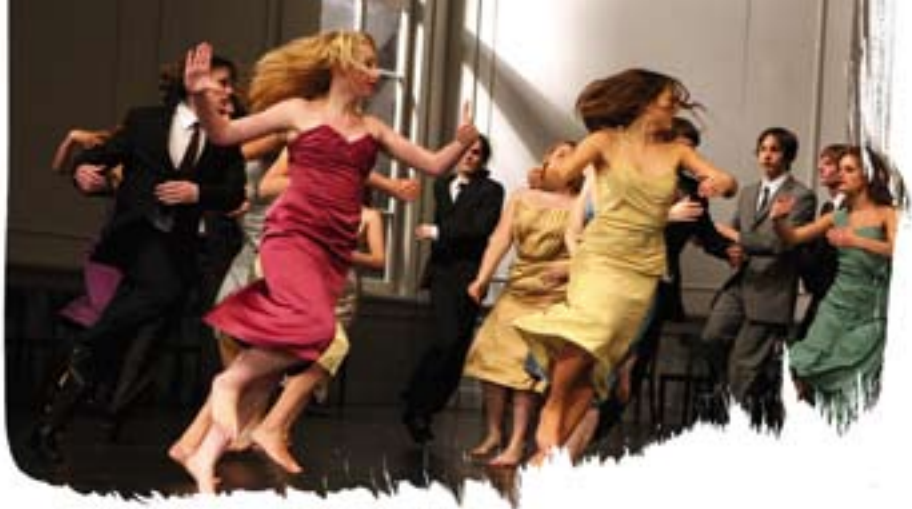
Figure majeure de la danse depuis les années 80, Pina Bausch nous a quittés en 2009. Pièce phare de ses débuts, « Kontakthof » – créée en 1978 – expose l'âpre relation entre les hommes et les femmes, la quête de l'amour et de la tendresse. Un théâtre dansé qui exacerbe les sentiments les plus intimes et leur fait atteindre l'universel par le mouvement. Dans un décor immense, une grande salle de bal fanée, quasi vide, un piano, des chaises et une large vitre, des danseurs rejouent les rapports de séduction, l'hypocrisie des sentiments aussi.

En 2000, fabuleuse audace, elle transmet la pièce à des hommes et des femmes d'âge mûr. Autres vérités des corps marqués ou délaissés. En 2008, elle la confie à de jeunes danseurs, originaires de Wuppertal où siège le Tanztheater. La même pièce, avec les mêmes mouvements et les mêmes musiques de Charlie Chaplin ou Nino Rota, dans la même salle de bal. Eclat des corps juvéniles, ces adolescents qui jouent les adultes dans leurs costumes stricts continuent à faire vivre cette pièce mythique.